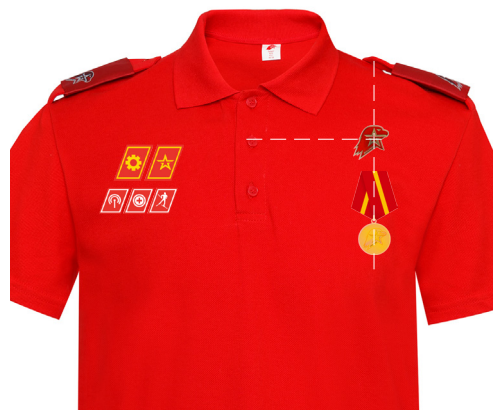
Размещение знаков различия, знаков отличия и иных геральдических знаков на рубашке поло красного (синего) цвета