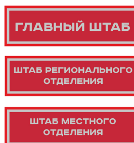
Нарукавный знак, устанавливающий принадлежность к структуре органов ВВПОД «ЮНАРМИЯ»