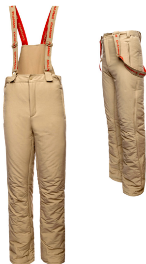
Брюки утеплённые (тактические) бежевого цвета